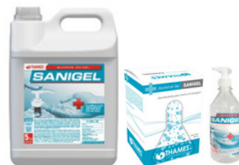
SANIGEL Alcohol en gel Sin fragancia Bidón x 5lts. 800ml bag in box (líquido) 250ml/500ml botella con dosificador Aprobado por SENASA y ANMAT