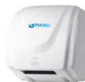
FENIX Carcasa metálica blanca. Sensor infrarrojo: funciona sólo cuando capta movimiento. Secado de manos en 30 segundos. Potencia: 1800w