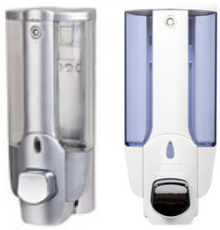
DELUXE PVC/Acrílico Plata, Blanca 350ml

Aptos para ser utilizados con jabón líquido cosmético, bactericida, industrial y alcohol en gel. Sistemas de relleno a granel, espuma y pouch bag in box.