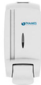
ESPUMA BAG IN BOX ABS Blanco 800ml