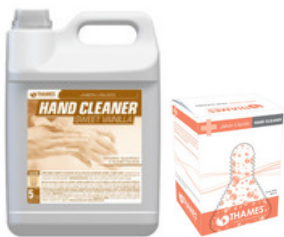
HAND CLEANER Jabón cosmético Mango, Manzana, Tropical, Sweet Vanillia Bidón x 5lts. 800ml bag in box (líquido) 800ml bag in box (espuma) Aprobado por ANMAT

Amplia gama de productos y presentaciones para una correcta higiene de manos.