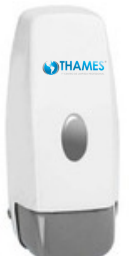
BIG ABS Blanco 1400ml