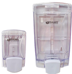
CLEAR PVC/Acrílico Transparente 400ml-1000ml