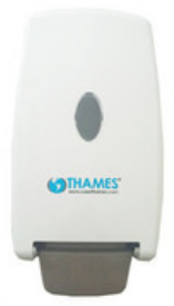
SPRAY* BAG IN BOX ABS Blanco 800ml *Alcohol en spray