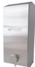
ACERO Acero Satinado 900ml