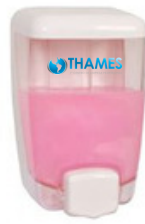
BULKY PVC/Acrílico Blanco 1000ml