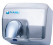
STORM Acero inoxidable con acabado satén. Sensor infrarrojo: funciona sólo cuando capta movimiento. Tolva gira 360°. Secado de manos en 10-15 segundos. Potencia: 2500w