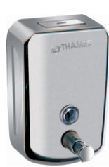
ACERO Acero Satinado 800ml