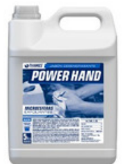
POWER HAND Jabón desengrasante Sin fragancia Bidón x 5lts.