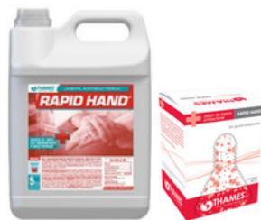
RAPID HAND Jabón antibacterial Sin fragancia Bidón x 5lts. 800ml bag in box (líquido) 800ml bag in box (espuma) Aprobado por SENASA y ANMAT